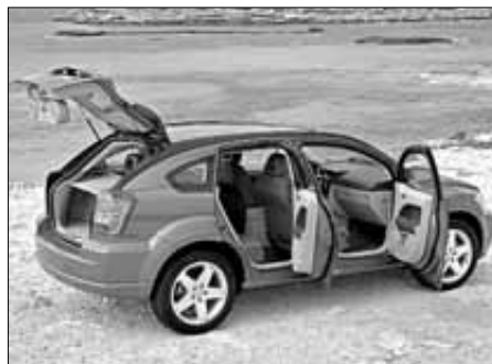
Sus cinco puertas le dan amplitud