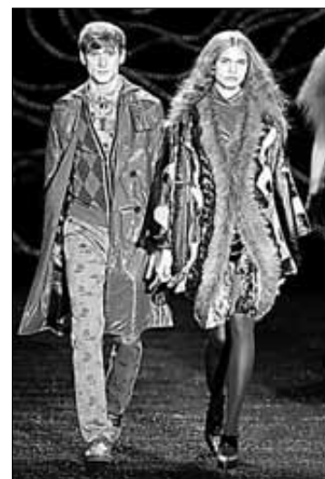
Varios momentos del espectacular desfile de Custo Barcelona en la pasarela de la Fashion Week en el Bryant Park de Nueva York