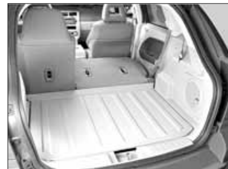
Conjuga comodidad y espacio