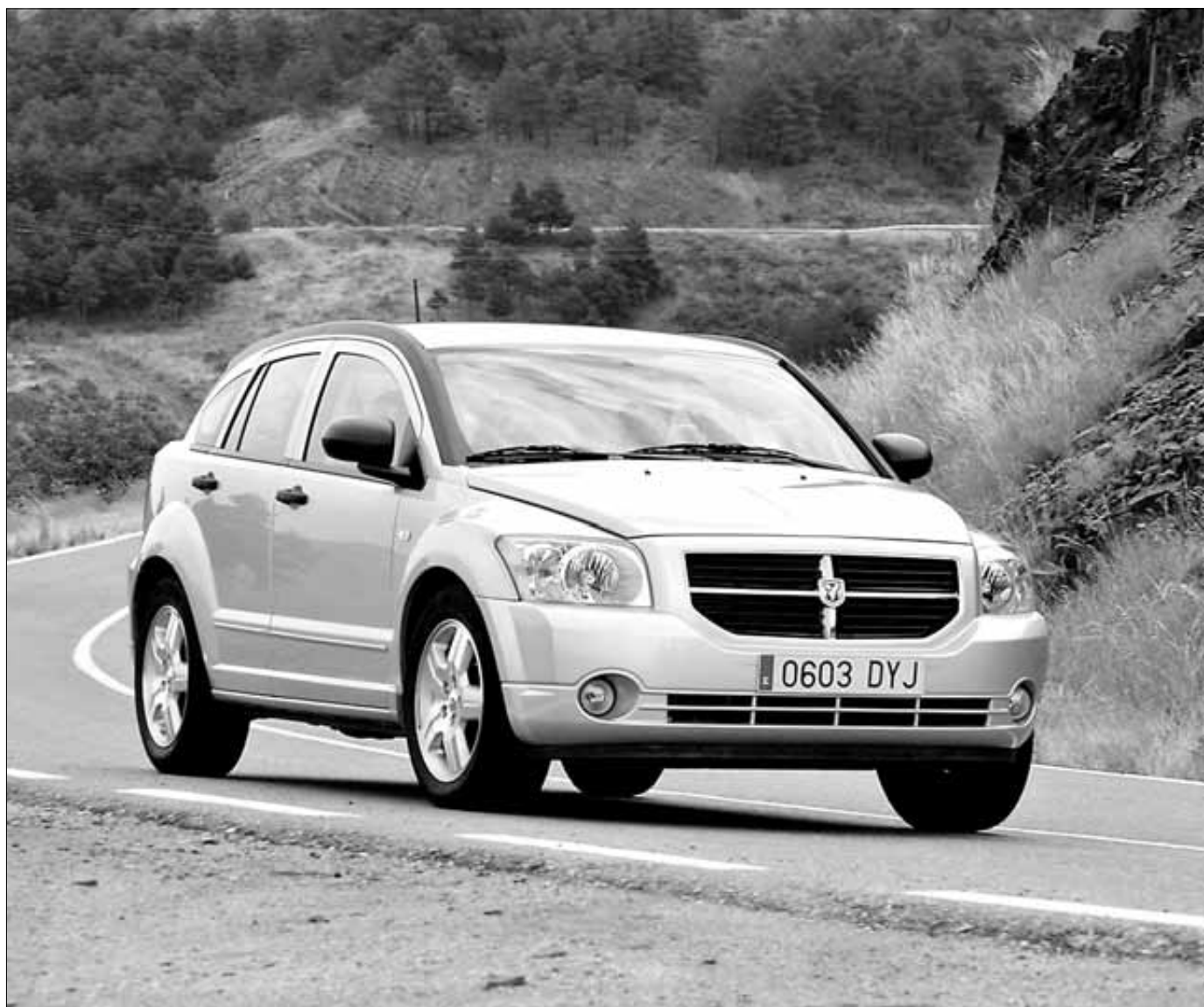
El Caliber es un coche con muchas posibilidades en uno sólo, por lo que tiene un mercado atractivo

No se olvida Dodge del apartado de seguridad en el que ofrece dos airbags frontales, airbags de cortina que protegen las plazas delanteras y las traseras. ABS con distribución electrónica de la frenada EBD. Programa electrónico de estabilidad ESP con asistencia a la frenada de emergencia y