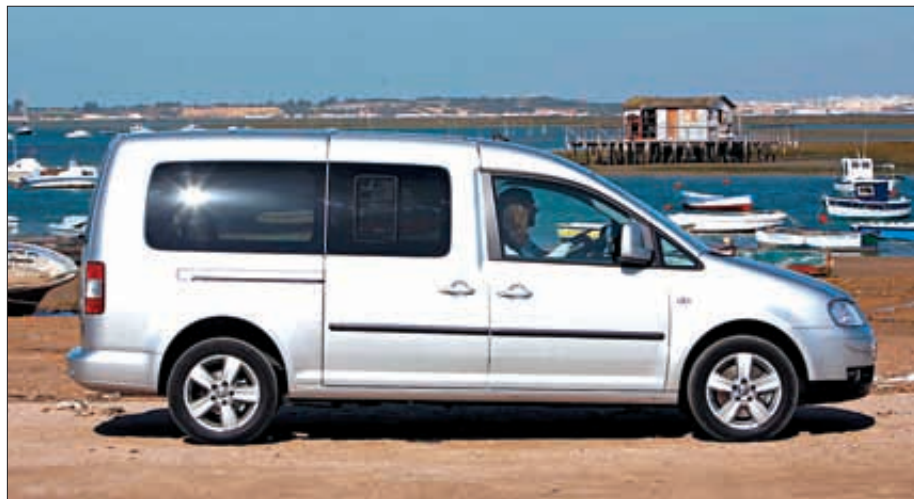
El nuevo Caddy Maxi llega a nuestro mercado con más confort, dinamismo y tecnología

El motor que equipa es el Twin Cam 96B de 1586 cc con ejes equilibrados con transmisión Cruise Drive de 6 velocidades y sistema activo de admisión y escape. Sin embargo, para todo aquel que se haya quedado con ganas de disfrutar de una de estas atractivas motos, informamos que existe la oportunidad de reservar desde ahora la Rocker C para el próximo 2009 en cualquier concesionario.