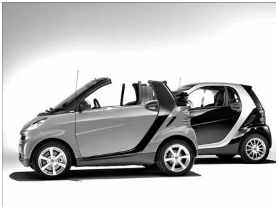
Joven, funcional y dinámico, el Smart Fortwo Cabrio está muy bien terminado

El equipamiento difiere según sus versiones: el 'Pure', con imagen funcional y tres motores (diésel Cdi 45 CV y gasolina 61 y 71 CV); 'Pulse' con corazón deporti-