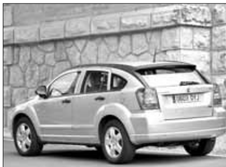
Un diseño sorprendente

anclada a su parte inferior, lo que facilita su manipulación por parte del conductor. Y frente al pasajero hay una guantera con dos niveles, uno superior para cuatro envases y uno inferior de generoso tamaño.