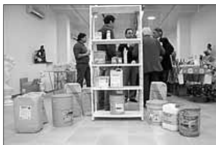
Sika dispone de un amplio abanico de productos químicos para la construcción

Sika ofrece todo tipo de soluciones innovadoras en el campo de los productos químicos para la construcción, especialmente indicadas y concebidas para la restauración de la obra vieja. Entre la familias de productos que esta multinacional distribuye en el mundo destacan la producción de mortero, hor-