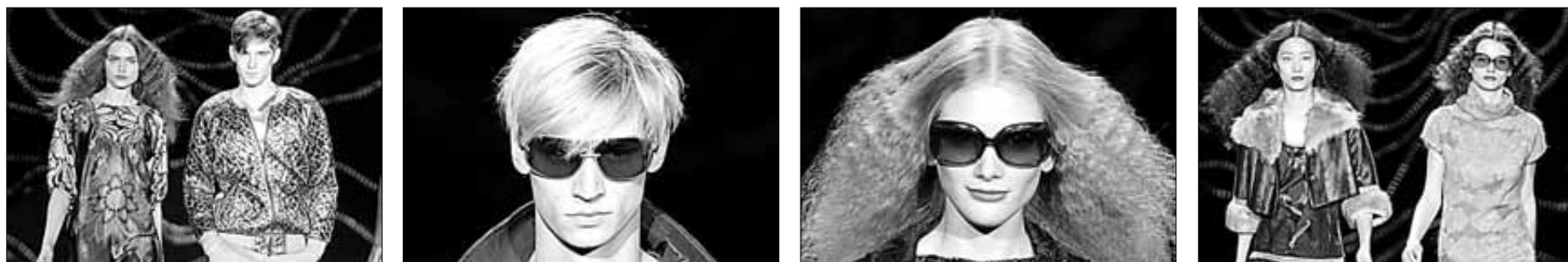
La colección otoño-invierno de Custo destaca por la diversidad de propuestas y prendas, así como la presentación de las gafas que estarán a la venta este verano en Custo Ibiza