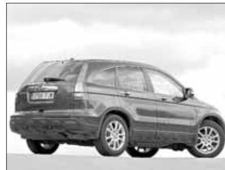
Vista lateral del modelo

El CR-V se comercializa en varios acabados diferentes: Comfort, Elegance, Executive, Luxury e Innova. En cualquiera de ellos el equipamiento de serie es generoso