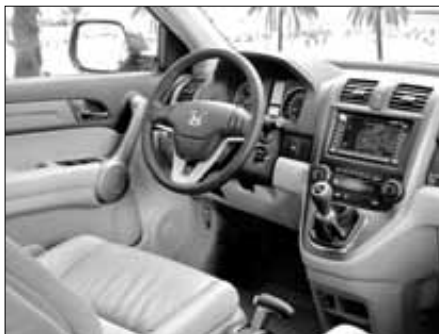
Puesto de conducción

El Honda CR-V se comercializa en los acabados Comfort, Elegance, Executive, Lu-