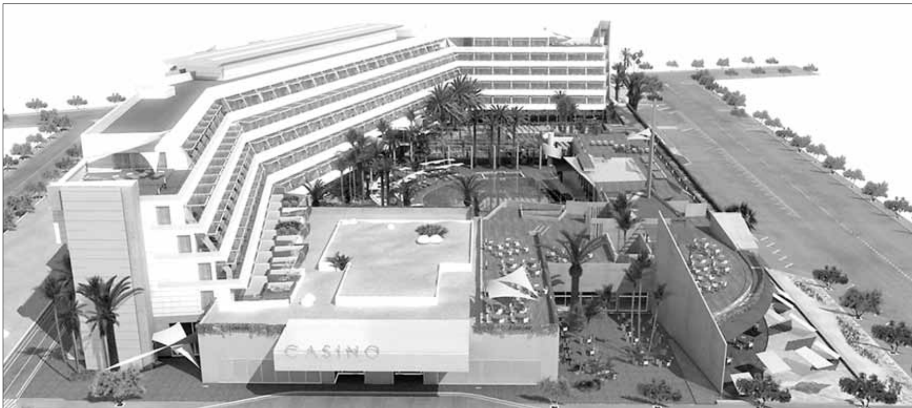
Imagen panorámica del Ibiza Gran Hotel, que abrirá próximamente sus puertas, ampliando así la oferta de establecimientos cinco estrellas de Eivissa

En el lobby , se encuentra la obra 'Existence-Stairs' de Bahk Seonghi, realizada con carbón a través del cual revolotea la luz; y también la obra 'Asia' de Miguel Gómez Losada, un mural de telas de papel que elogia a la naturaleza. En el Restaurante Costa Mara destaca las fotografías de Concha Prada; en el bar- lounge La Gaia, podrán observarse la obra fotográfica de Tony Keeler.