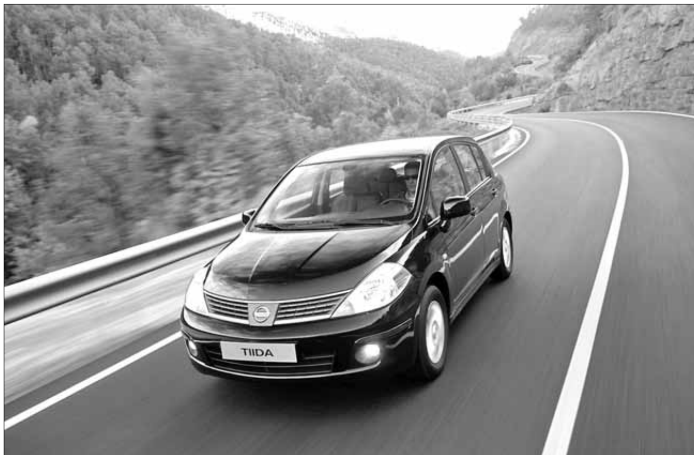
Nissan ha acertado de pleno con el diseño del nuevo Tiida, ya que es un coche muy completo

NISSAN ABOGA POR UN COCHE PARA LOS CLIENTES MÁS TRADICIONALES, PERO NO DESCUIDA EL CONFORT, LA ELEGANCIA Y LAS PRESTACIONES DE LOS VEHÍCULOS ACTUALES. ESTÁ DISPONIBLE EN TRES MOTORIZACIONES (DOS GASOLINA Y UNA DIÉSEL)