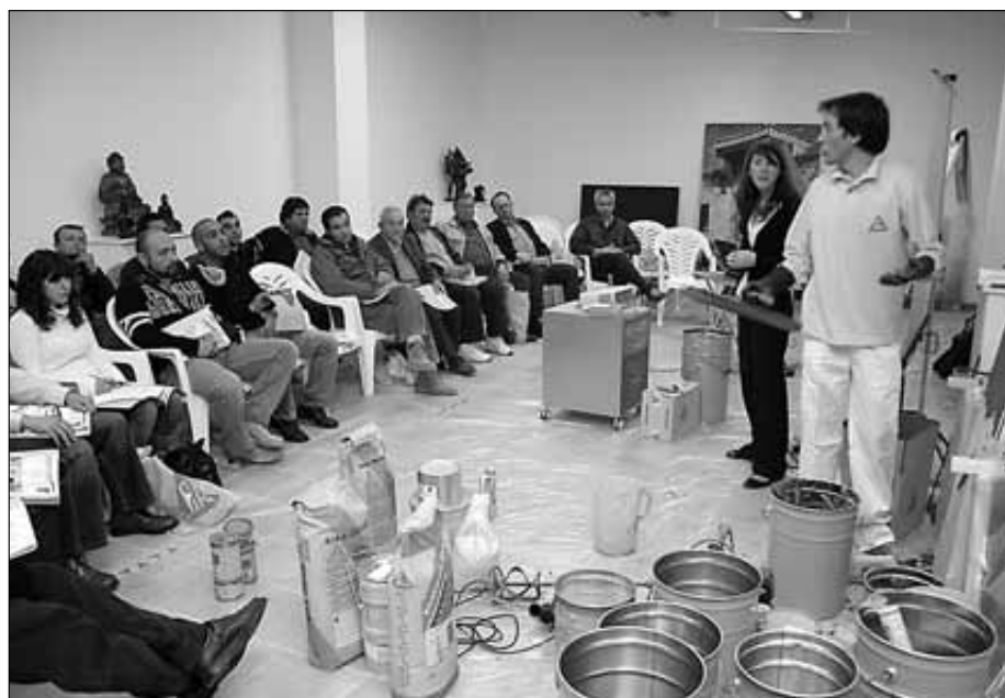
La jornada formativa se llevó a cabo en las instalaciones de Fita