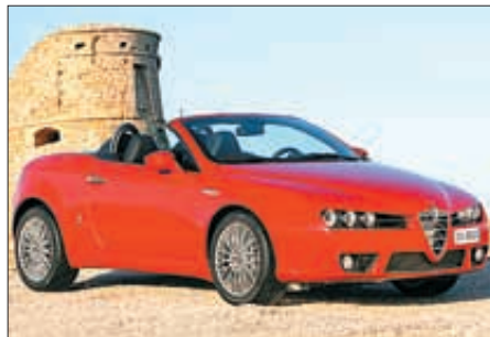
Alfa Romeo pone en exposición un Alfa Brera y un Spider

Después del rotundo éxito que la Feria obtuvo el año pasado, Art Madrid afronta este 2008 aumentando el espacio expositivo y el número de galerías. El salón albergará 80 galerías, 21 de las cuales serán internacionales, 6 latinoamericanas, 4 norteamericanas, 10 europeas y 1 coreana. Entre las europeas desta-