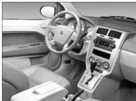
El interior es práctico y eficaz