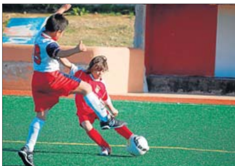
El Jesús B perdió con el Insular At. por 2-7