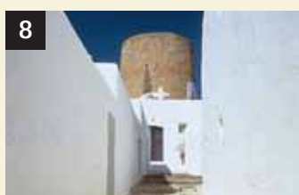
8 Tesoro Balàfia