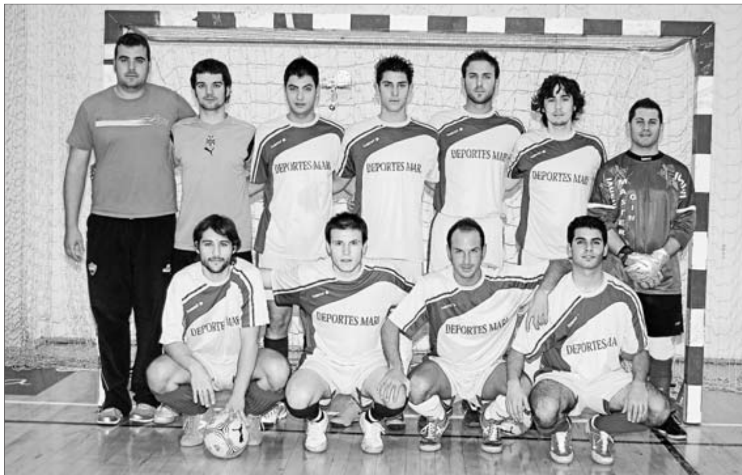
Foto de formación del equipo senior del Ruy F.S.

En cuanto a la Liga de Can Mises, el Discobús es el nuevo líder, aunque empatado a puntos con el Bar Es Puig. Por ahora, decide la diferencia de goles.