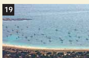
19 Tesoro Estany Peix