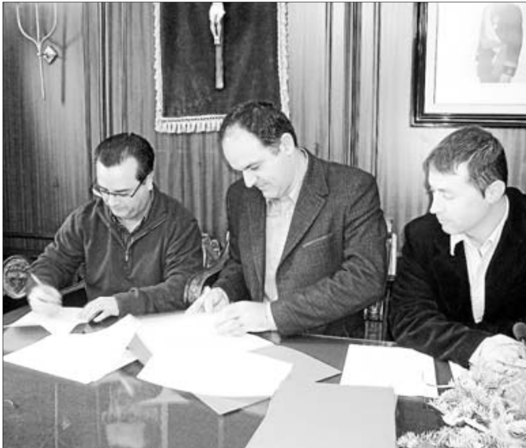
Instante en que el presidente del CB Puig d'en Valls firma su convenio con el Ayuntamiento D. I.