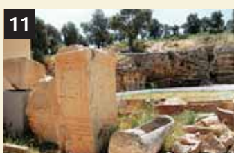
11 Tesoro Necrópolis