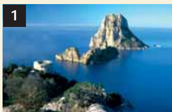
1 Tesoro Vedrá