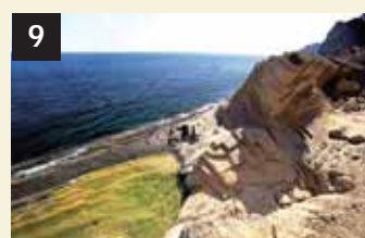
9 Tesoro Cala d'Hort