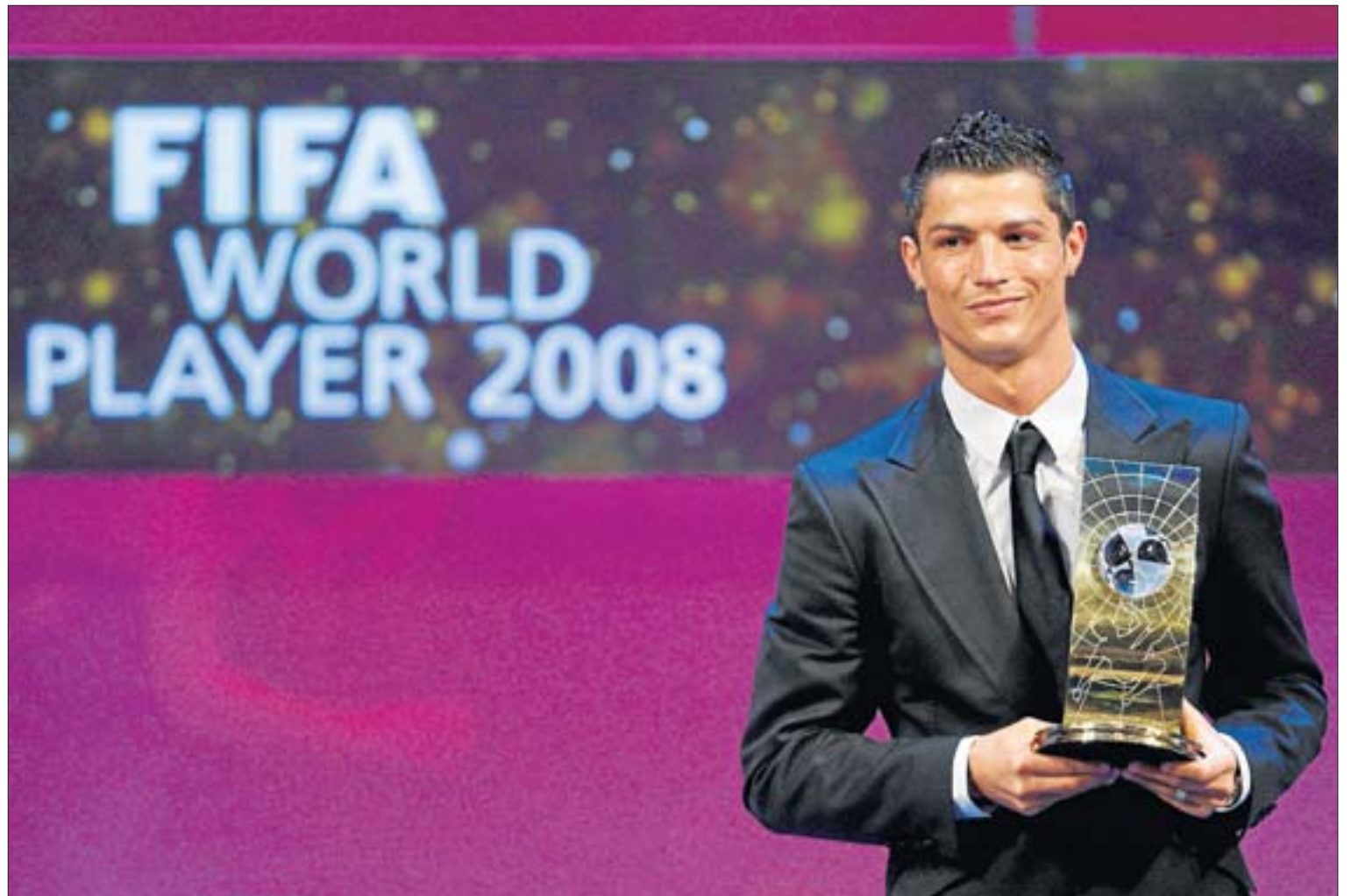
El futbolista portugués Cristiano Ronaldo posa con el trofeo a Mejor Jugador del 2008 durante la Gala celebrada ayer

El luso, artífice de la extraordinaria campaña realizada por los 'red devils', que conquistaron la 'Premier League' y la Liga de Campeones, no pudo brillar en la Eurocopa por la lesión en el tobillo de la que fue operado posteriormente, pero hace algunas semanas lideró de nuevo a su equi-