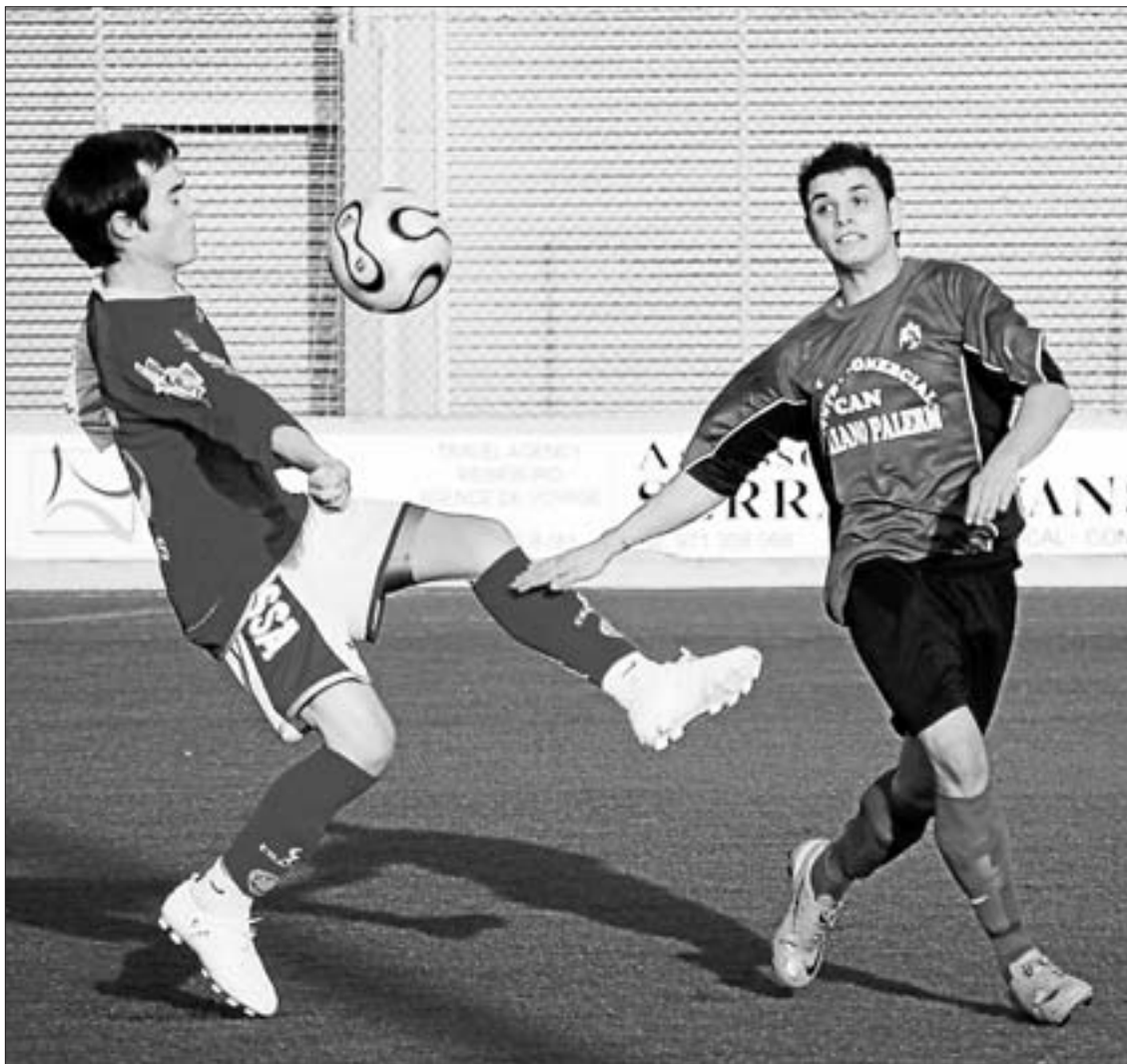
Un instante del duelo entre el Sant Jordi y el Eivissa

Son los que se marcaron en la primera jornada del año 2009 en la Liga Preferente juvenil. El partido donde más goles se vieron fue en duelo entre el San Rafael y el Atlético Jesús B, que acabó con victoria de los rafelers por 4-2.