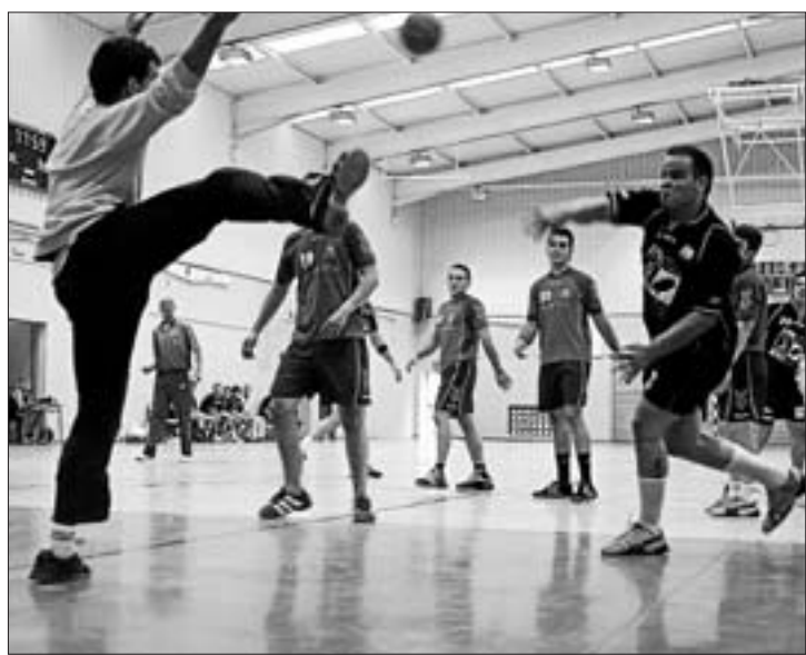
Imagen de archivo de un partido de esta temporada