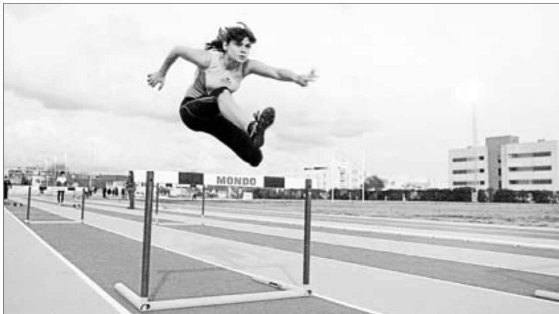
Un instante de una de las series de vallas que se corrieron en el control del pasado sábado

metros. La delegación no informó si se registraron mínimas para los nacionales de pista cubierta. Competieron cerca de 70 atletas en las diferentes pruebas de marcha, vallas, velocidad, medio fondo, peso y longitud.