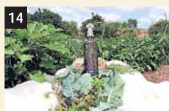
14 Tesoro Herbes