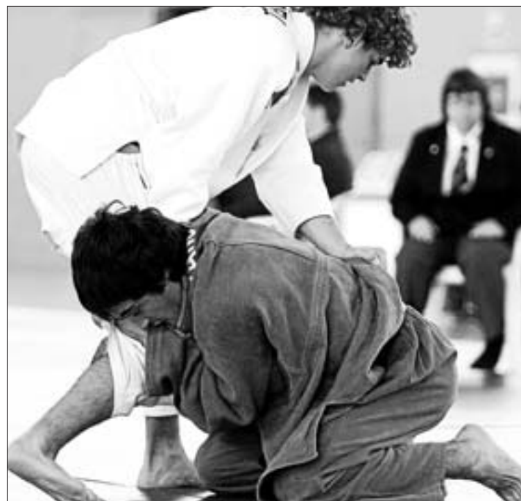
Un instante de la competición celebrada en Sant Antoni

A los competidores de las categorías junior, les ha venido bien la cita sanantoniense como preparación y rodaje previo al campeonato de Baleares de su grupo de edad, que se disputará el próximo 24 de enero.