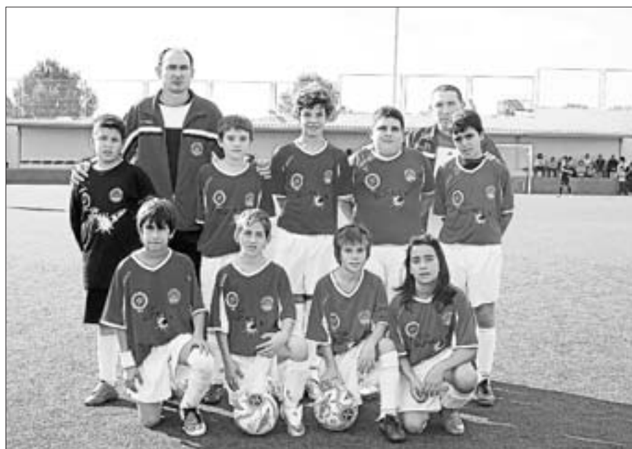
Atlético Isleño B alevín