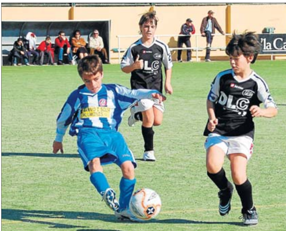
La Peña Blanc i Blava A goleó por 6-0 al Santa Gertrudis

En cualquier caso, en los tres grupos hay varios equipos empatados a puntos y por el momento los primeros puestos se resuelven con las diferencias de goles.