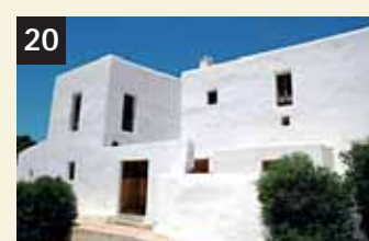
20 Tesoro Casa Pagesa

Todos los participantes pueden votar por lugares o elementos distintos de Eivissa y Formentera. Sólo puede emitirse un voto por cada correo, mensaje, carta o votación electrónica.