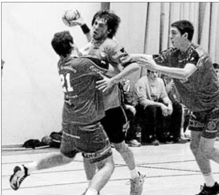
Una acción de juego en el HC Eivissa juvenil-Granollers juvenil

El BM Granollers juvenil continúa estrechando lazos con el balonmano pitiuso. Este fin de semana disputó varios amistosos con equipos del HC Eivissa, tanto en el pabellón de Es Viver como en el municipal de Es Pradet en la jornada del sábado. El plato fuerte fue el choque con el bloque senior del Puig d'en Valls el domingo. Esta es una de las iniciativas de promoción que están llevando a cabo en coordinación los responsables técnicos del HC Eivissa. El intercambio es el aspecto que más interesa a los preparadores tanto del club anfitrión como de los invitados, como fue el 'Puchi'.