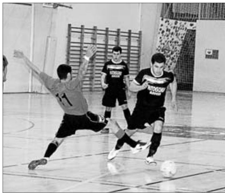
Un lance del Cas Serres-Ruy F.S. de juveniles

También volvió la actividad al Torneo de Clasificación de veteranos de fútbol-7. Tras la disputa de una nueva jornada, en el grupo 1 la Peña Deportiva es el nuevo líder provisional, desbancando de este puesto al conjunto de Frutas La Palentina. Los de Santa Eulària ganaron por 4-1 al Bar Internacional. Mientras, Frutas La Palentina descansó. En el grupo 2 se mantiene al frente la Peña Independiente, que ganó su noveno partido consecutivo. Fue tras doblegar al Atlético Isleño Sa Torre II por 7-1. Segundo también sigue el Bahía San Agustín.