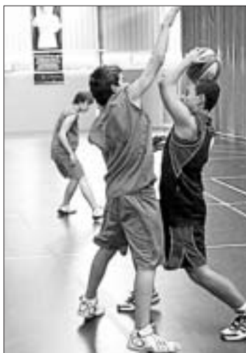
Sa Real A - El Hotel Sa Bodega L.P.

Sus compañeros del Sa Real C Frutas La Palentina, que tan sólo han perdido no disputaron su choque ante el Viatges es Freus Ses