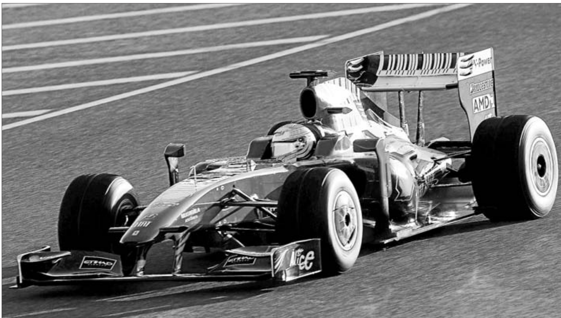
El piloto brasileño de Fórmula Uno, Felipe Massa, conduce el nuevo F60, el coche de Ferrari para la próxima temporada, ayer en Maranello

AUTOMOVILISMO CAMPEONATO DEL MUNDO DE FÓRMULA UNO