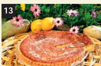
13 Tesoro Flaó