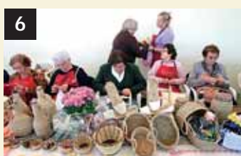
6 Tesoro Artesanía