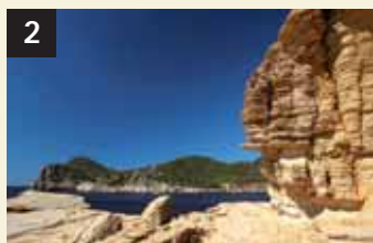
2 Tesoro Amunts