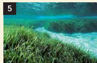
5 Tesoro Posidonia