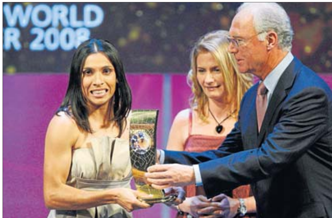
Franz Beckenbauer le entrega el premio a Mejor Jugadora del 2008 a la futbolista brasileña Marta