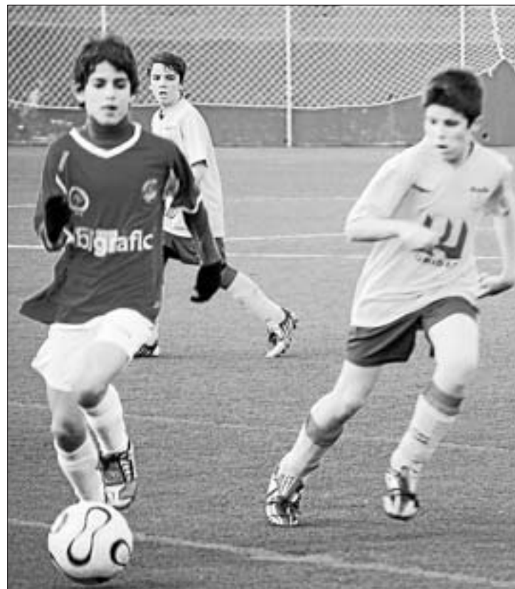
Ràpid y Eivissa acabaron empatando 1-1

SI HUBIERA GANADO SE HABRÍA SITUADO PRIMERO DE FORMA PROVISIONAL, PERO EMPATÓ 1-1 CON EL RÁPID