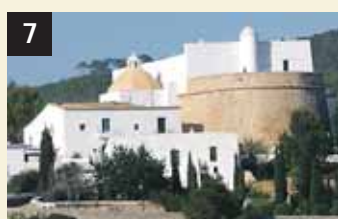
7 Tesoro Santa Eulària