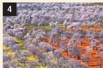
4 Tesoro Corona