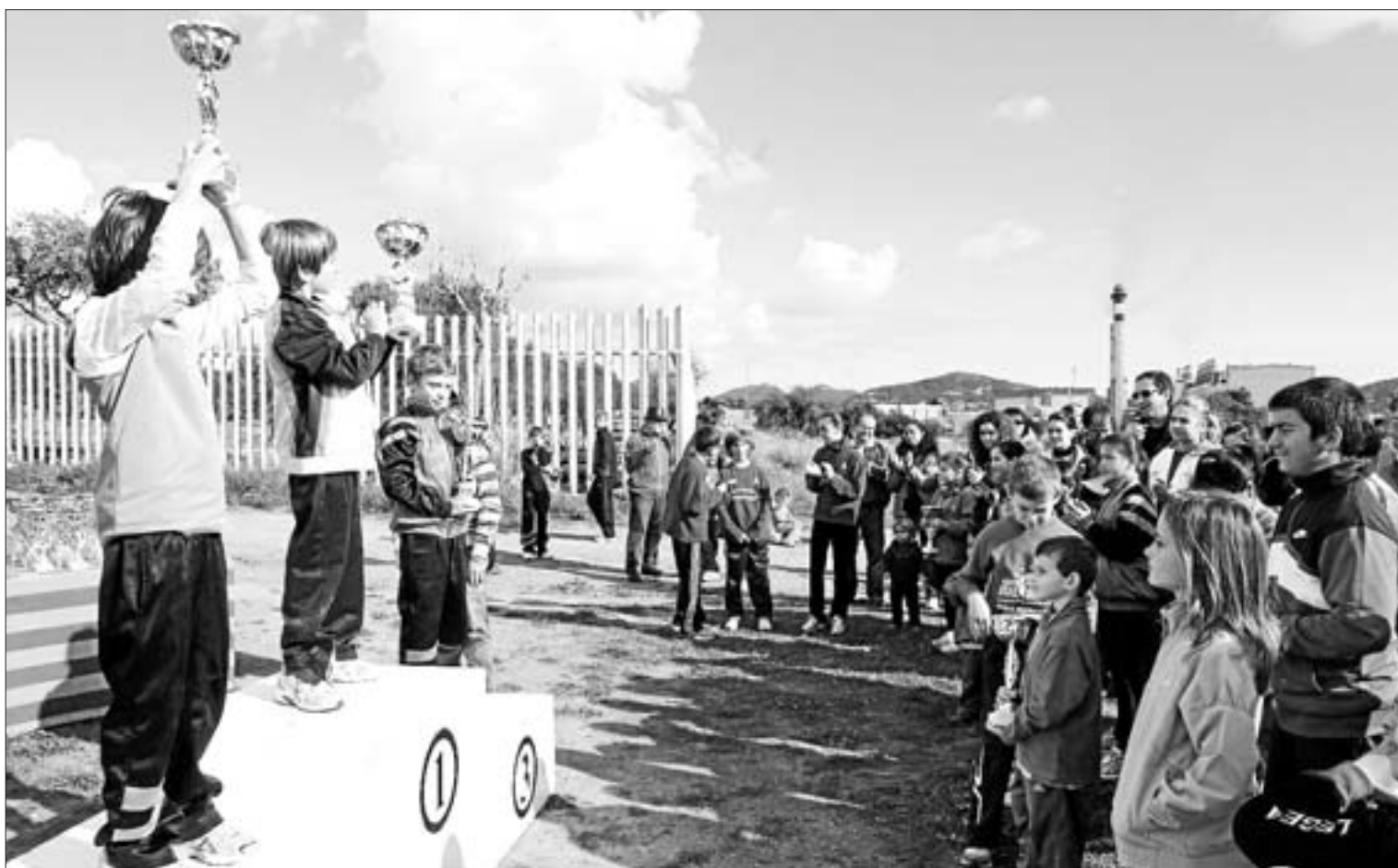
Los atletas suben sus copas ante sus familiares y amigos durante la entrega de trofeos para las categorías inferiores