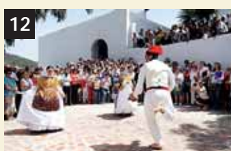
12 Tesoro Ball pagès