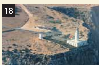
18 Tesoro Mola