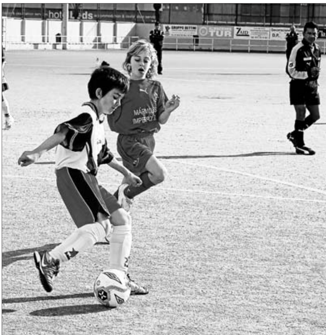
Insular y Sant Carles B protagonizaron un interesante partido