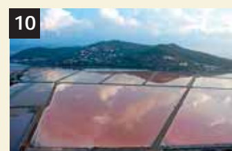
10 Tesoro Salines