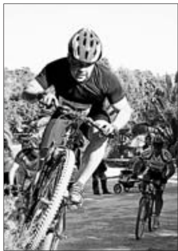
Foto de un duatlón

La zona de salida y llegada estará situada en la rotonda de Cala Gració, junto al cementerio municipal. Está prevista la participación de unas 70 personas. Las inscripciones se pueden formalizar en la web trijasa.com . Está abierta a cualquier corredor. Cuesta cinco euros.