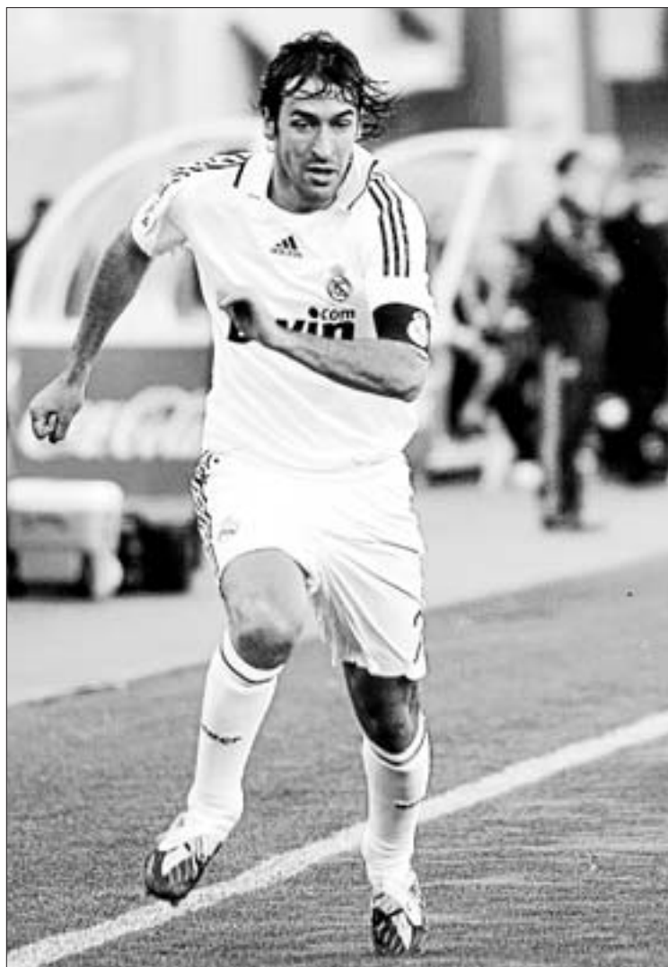
Raúl, durante el partido del domingo ante el Mallorca

Raúl González, que celebró con un gol en Mallorca su partido número 500 con el Real Madrid, advirtió de que el campeonato liguero no está resuelto todavía porque queda mucha Liga y el Barça tendrá su bache