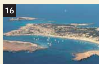
16 Tesoro Espalmador