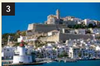
3 Tesoro Dalt Vila