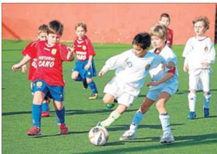
Imagen del encuentro entre el Isleño y el Portmany Atlètic

EN LA PRIMERA REGIONAL SE HA SITUADO LÍDER LA PEÑA DEPORTIVA A; EL SANT JOSEP EN LA SEGUNDA Y EL SANTA GERTRUDIS EN LA TERCERA