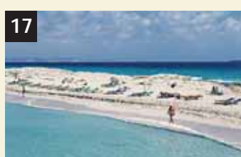
17 Tesoro Illetes