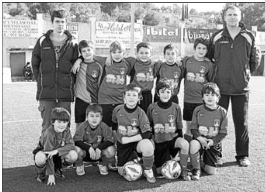
Sant Jordi Atlético benjamín