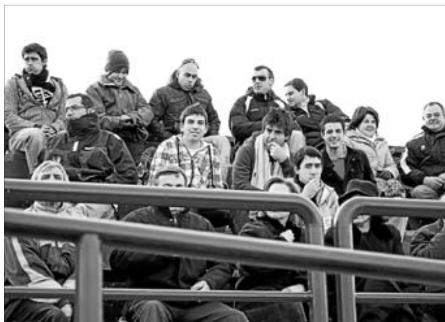
Público del partido que jugó el Sant Jordi juvenil