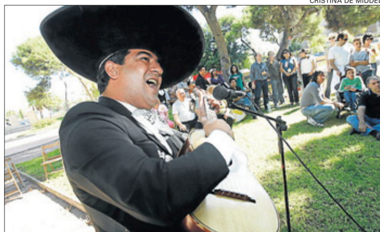
Un grupo de mariachis animó la fiesta de los mexicanos

Cerca de 150 personas se dieron cita en el Parque del Agua de Alicante para disfrutar del folclore y la gastronomía del país azteca. La Asociación de Mexicanos de Alicante fue la encargada de organizar, por segundo año consecutivo, esta fiesta «que reunió a muchos españoles, a representantes de otros colectivos de inmigrantes y por supuesto a buena parte de la comunidad de in-