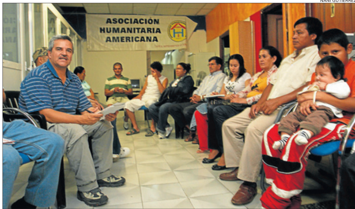
Unas 25 familias con dificultades para hacer frente a sus hipotecas se reunieron en Alicante el pasado fin de semana