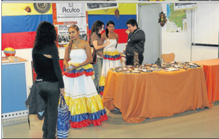
En Interplural han participado las principales asociaciones de la provincia

un fuerte componente lúdico, ha sido muy valorado por parte del público, que además ha sido muy participativo en las distintas actividades tanto en ponencias como en los distintos talleres que se han llevado a cabo. «En esta feria hemos hecho un esfuerzo especial en acompañar la oferta comercial con un amplio