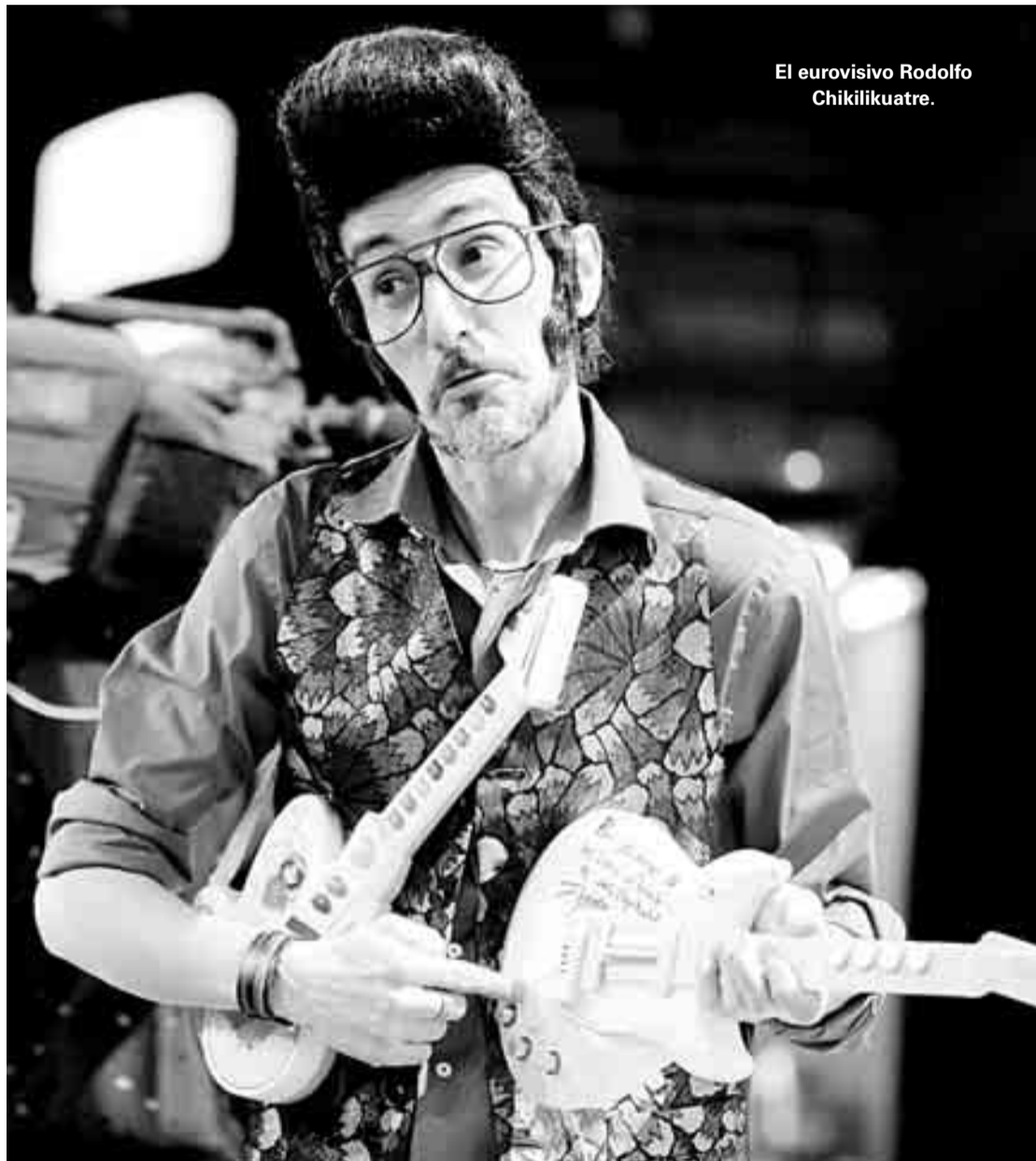
El eurovisivo Rodolfo Chikilikuatre.

autores cuando pensamos en una gran parte de la programación televisiva, en la desaforada promoción de productos literarios vacuos, en el fomento de actitudes antiintelectuales y la sustitución del prestigio de la inteligencia por el de la fuerza física, en la utilización de la mujer como objeto sexual en la cultura, en el fraude en el arte, en el pretendido ocaso de las ideologías, en