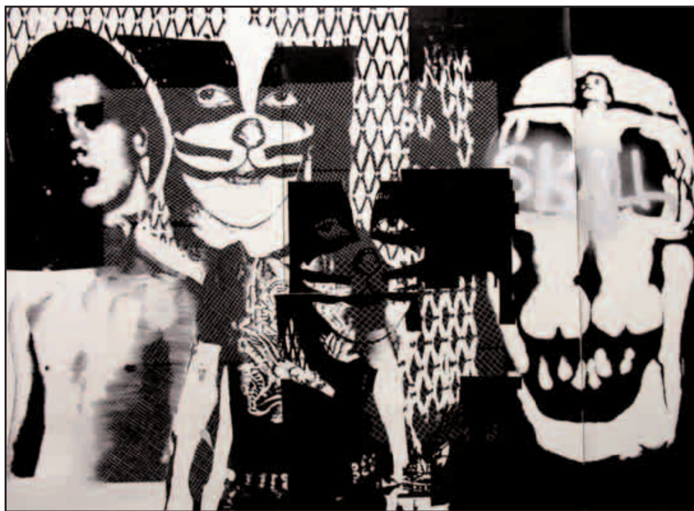
“24 horas 10 minutos”, de Salvador Cidrás.

Ao longo da historia o tratamento da realidade e a mítica orixe do poder aparece representada en infinitas ocasións. O mítico aparece dende a propia consideración dos emperadores romanos co-