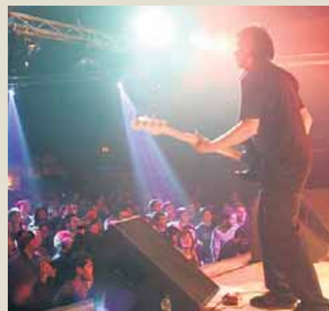
Sobre estas líneas (arriba) des imágenes del festival Exponentes 2006, los componentes de Columpio Asesino en una imagen promocional (Centro) y los integrantes Schwarz y Niños Mutantes (abajo)

La guinda del pastel del festival será una gran fiesta que se celebrará en el Café D’Jembé y que contará