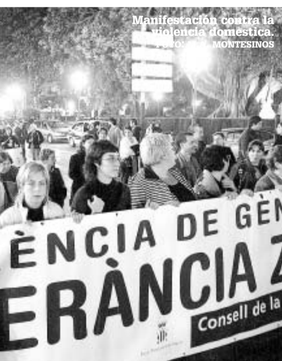
20/08. Gandia (Valencia): Un joven de 23 años acaba con la vida de su ex mujer tras asesarle siete cuchilladas.