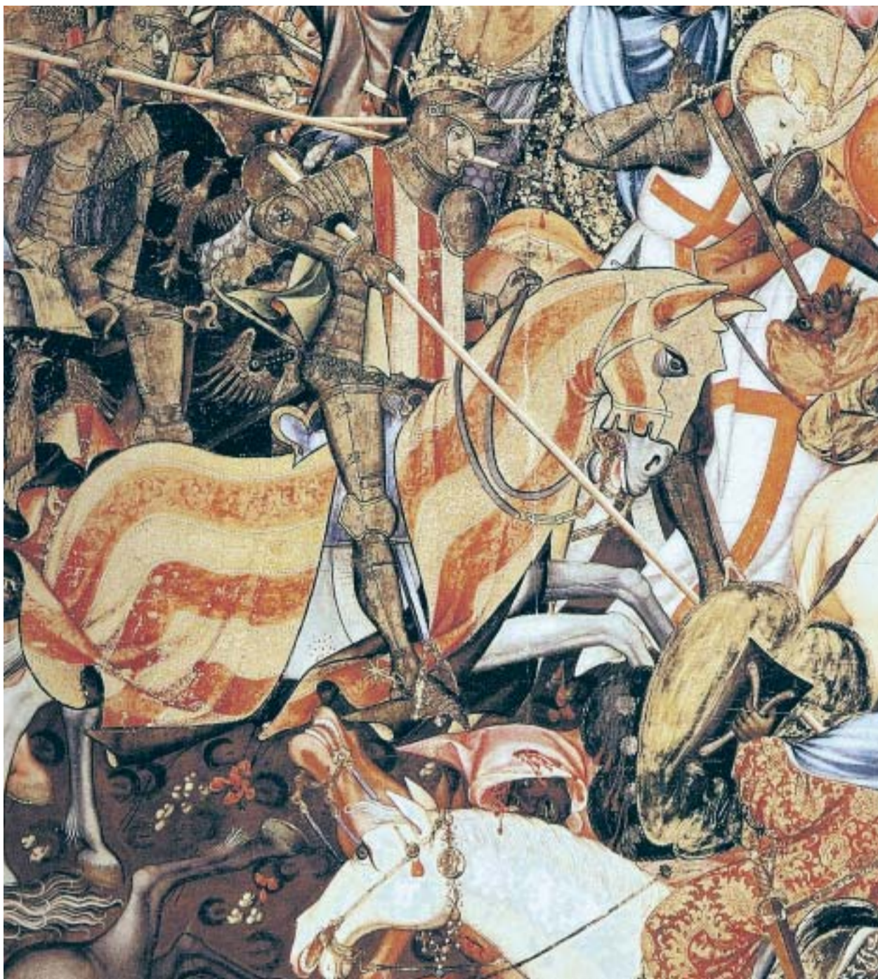
Dalt, fragment de la batalla del Puig, de Marçal de Sax, on apareix Jaume I, encara que no hi participà.