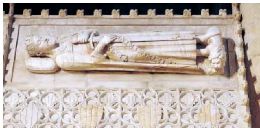
Tomba de Jaume I al monestir de Poblet.